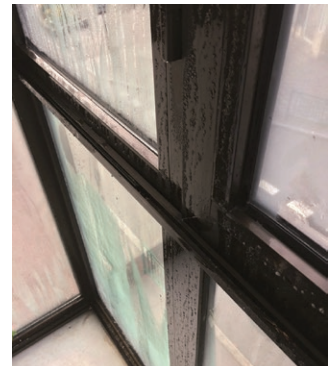
Exemple de condensation au niveau d'une menuiserie

vitrages, la température surfacique peut être très inférieure à celle de l'air ambiant. L'air au contact de cette surface se refroidit, et une partie de la vapeur d'eau qu'il contient se condense en eau liquide. Cette surface deviendra donc rapidement le siège de condensations, voire de ruissellements dès que la température extérieure sera très inférieure.