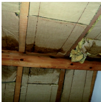
Exemple de condensation au travers de la paroi (photos prises après démontage des lambris). (absence de pare vapeur intérieur)

En l'absence de pare-vapeur côté intérieur, la vapeur d'eau se diffuse au travers de la paroi. Sous l'effet de l'abaissement de la température, elle va se condenser au droit du point de rosée. L'eau ainsi formée à l'intérieur de la paroi peut provoquer des dommages (humidification des isolants...).