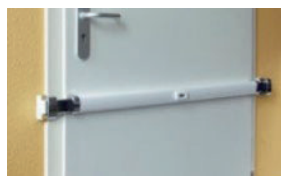
Renforts de portes