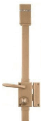
Serrure de sécurité

alarme - sirène avec ou sans transmetteur. Une sirène sera dissuasive. Il est recommandé de faire installer cet équipement par un professionnel.