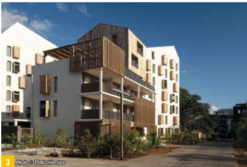
3 Photo © TT Architecture